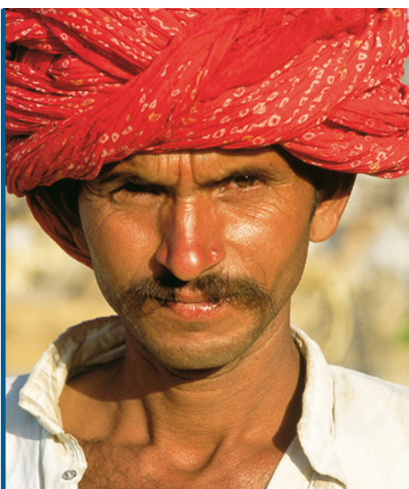
Mann am Pushkarfest